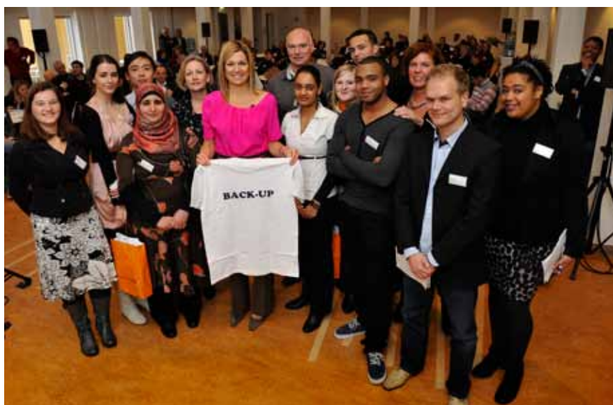
Prinses Máxima met het Back-up team – met rechts van Máxima 'kopsterke spits' Willem

Het Oranje Fonds – een van de subsidiënten van School's cool Delft – organiseerde op 2 december jl. de werkconferentie "Back-up" in het Museum voor Communicatie in Den Haag. De conferentie stond in het teken van de diverse maatschappelijke initiatieven die momenteel bestaan en die gebruik maken van de inzet van vrijwilligers om de schoolkansen van jongeren te vergroten. Namens School's cool Delft waren Joan Koene, Mirjam Biegstraaten en Willem van Haasteren, een van de mentoren, aanwezig.